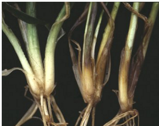
Billede 1. Knækkefodsye i hvede i foråret. Til venstre er en plante, der ikke er angrebet.

Knækkefodsye trives bedst i milde vintre og fugtige forår. Svampen kan overleve tre år på planterester af korn. Angreb ses derfor i marker med vintersædsdyrkning inden for de sidste to år. Tidlig såning fremmer angreb af knækkefodsye.